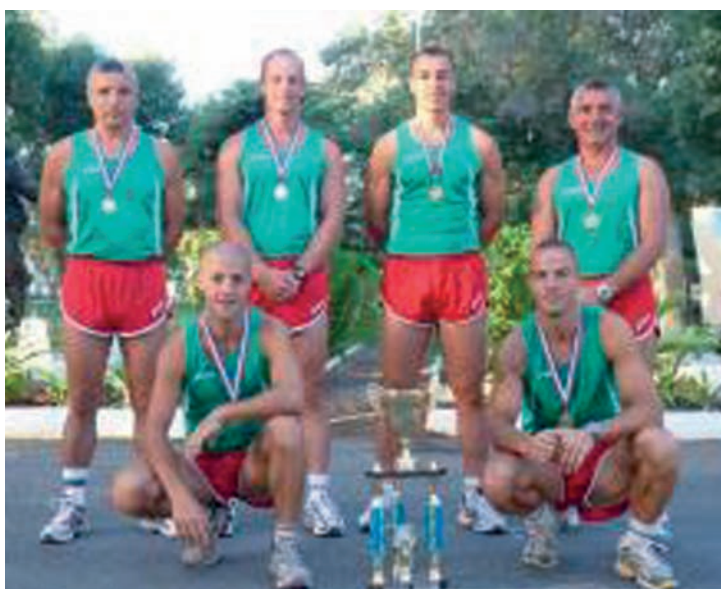
« RAID DES 5 MERVEILLES » Les vainqueurs de la 6 e édition.

Don à une association d'handicapés « Vivre plus fort », en novembre, à l'occasion de la célébration de la Journée Internationale des Personnes Handicapées.