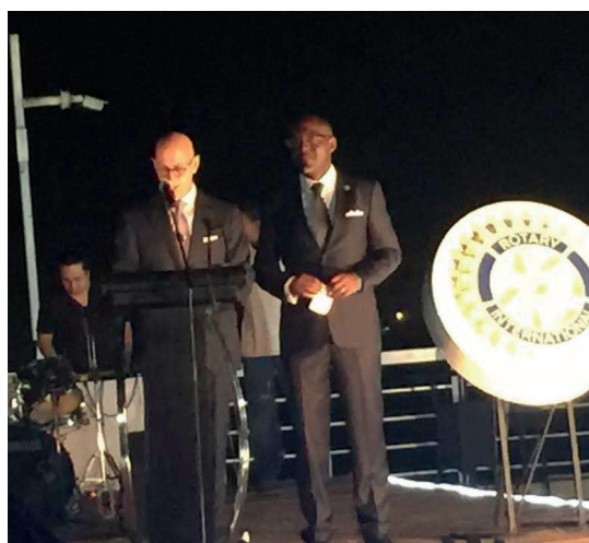
Soirée de gala organisée par le Rotary Club