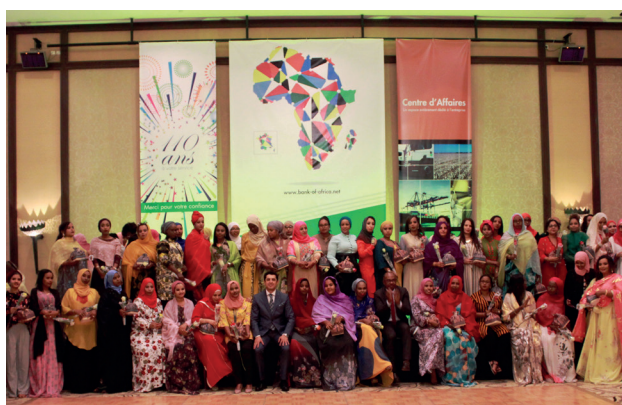
Journée Internationale de la Femme