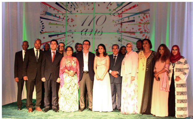
Célébration du 110e anniversaire de la Banque