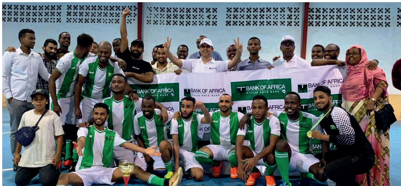
L'équipe de BANK OF AFRICA - MER ROUGE remporte un tournoi de Futsal