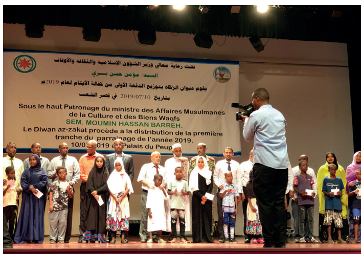
Programme de parrainage organisé par la Fondation Diwan Az Zakat